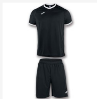
SET ACADEMY NEGRO-BLANCO M/C