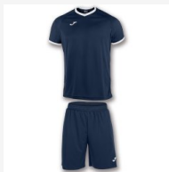
SET ACADEMY MARINO-BLANCO M/C